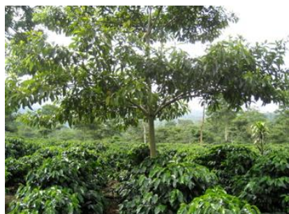
シェイドツリーの仕組み