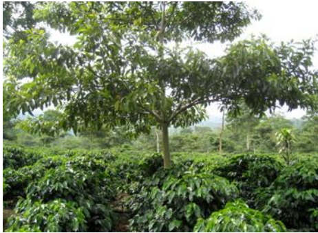
シェイドツリーの仕組み